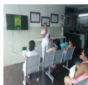
Categoría Educación continuada