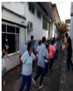
Categoría bienestar y salud